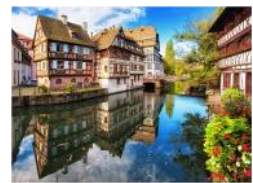
Zicht op het charmante centrum van Straatsburg.