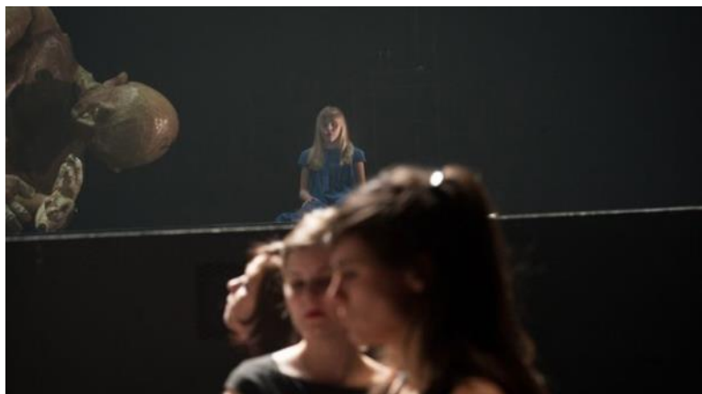
Scènebeeld uit Parsifal | © Kurt Van der Elst—NTGent

De voorstelling wordt muzikaal afgerond. Heel mooi.