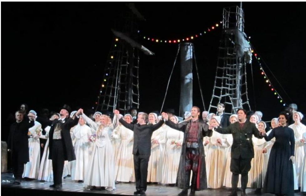
De volledige cast bij het enthousiaste slotapplaus.

Adolf Dresen kiest weliswaar voor een vrij traditionele benadering van Wagners ope- ra, maar hetgeen hij op scène laat zien leunt heel dicht aan bij wat Patrice Chéreau voor ogen had met zijn vermaar- de Ring–enscenering in Bayreuth einde jaren '70. We krijgen geen mythologise- rende, laat staan abstract- psychologiserende lezing van het verhaal, maar een anekdotische handeling die zich in Wagners eigen tijd afspeelt. De setting is puur 19 de eeuws en dit wordt vooral duidelijk bij de overgang naar de 2 de akte. De spinsters werken in een industriële omgeving die zo uit de film Daens ge- plukt zou kunnen zijn. De wijze waarop Senta haar ballade voordraagt draagt alle kenmerken van de wijze waarop in de 19 de eeuw tijdens volkskermessen de ac-