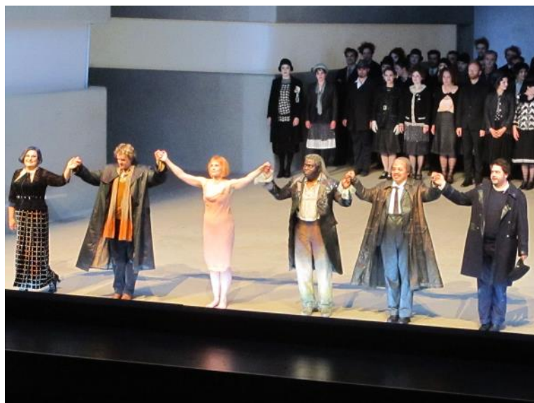
De cast na de voorstelling.