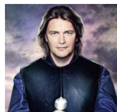
Klaus Florian Vogt zingt de titelrol in Lohengrin

→ Contacteer info@wagnervrienden.be om te reserveren en vermeld uw opstapplaats en de gewenste categorie.