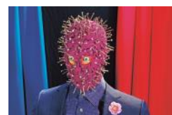
P r o m o b e e l d Tannhäuser