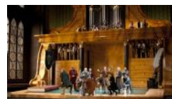
Die Meistersinger von Nürnberg op de Salzburger Festspiele

→ Contacteer info@wagnervrienden.be voor meer informatie.